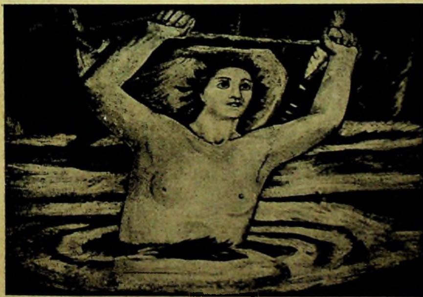
PARTICOLARE DELLA NASCITA DI ROMA - L'AURORA

FERRUCCIO FERRAZZI - PARTICOLARE DEL MUSAICO SULLA PIAZZA DI AUGUSTO IMPERATORE