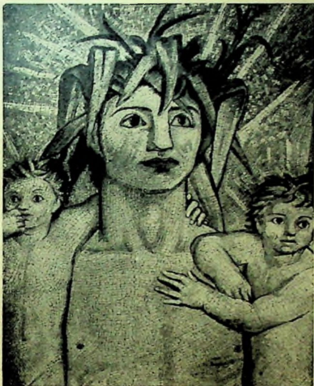
IL TEVERE E I GEMELLI