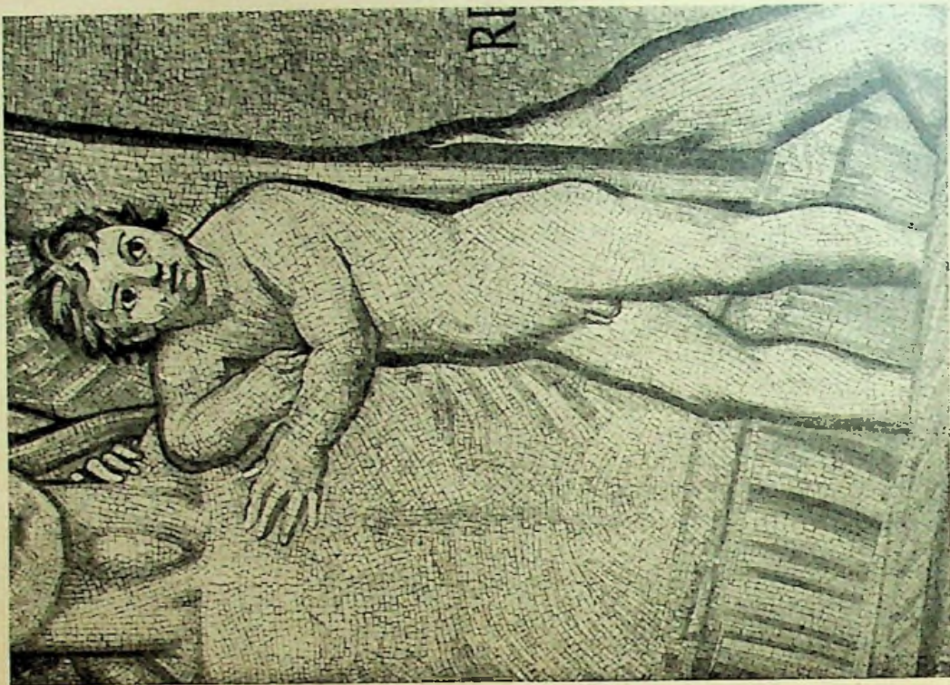
PARTICOLARE DELLA NASCITA DI ROMA - ROMOLO